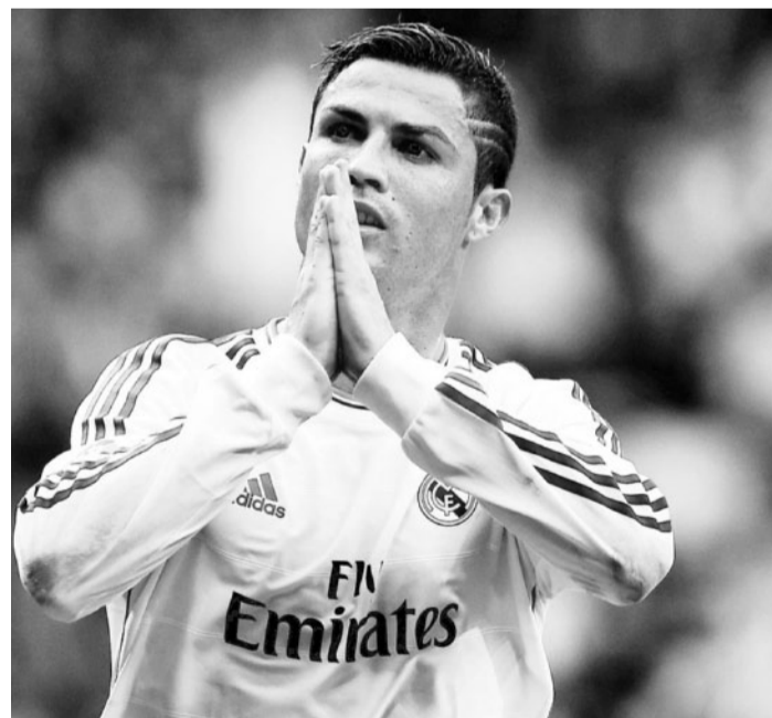
Beten für die WM? Ronaldo und Portugal, gegen Schweden droht ein heisser Tanz.

Allerdings blickt Frankreich nicht mit Stolz auf die letzte Playoffrunde zurück. Den Weg an die WM 2010 in Südafrika hatten sich die Franzosen durch ein Tor geebnet, dem ein klares Handspiel von Thierry Henry vorausgegangen war.