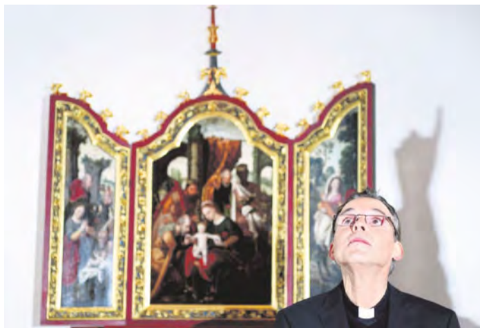
Angeschlagen. Bischof Franz-Peter Tebartz-van Elst steht wegen Residenz im Kreuzfeuer der Kritik.