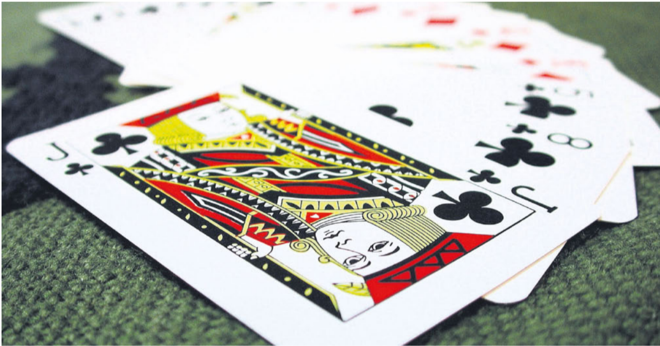
Bube schwarz. Die Karten auf der politischen Landkarte wurden aufgrund der letzten Wahlen neu gemischt.