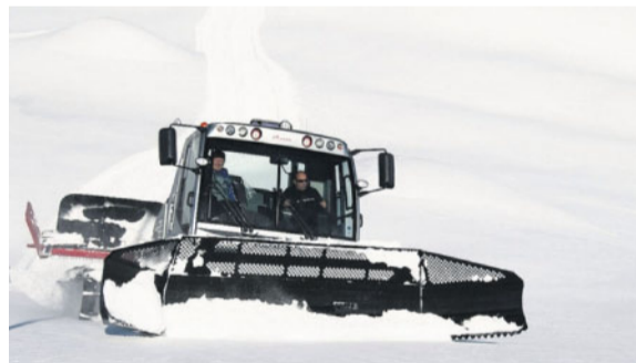
Günstiger. Pistenfahrzeuge zahlen künftig keinen Mineralölsteuer-Zuschlag mehr.